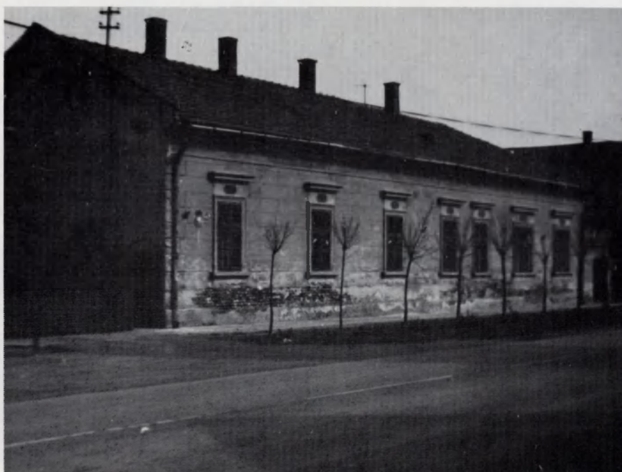
Hegedüs féle iskola (államosított ház)