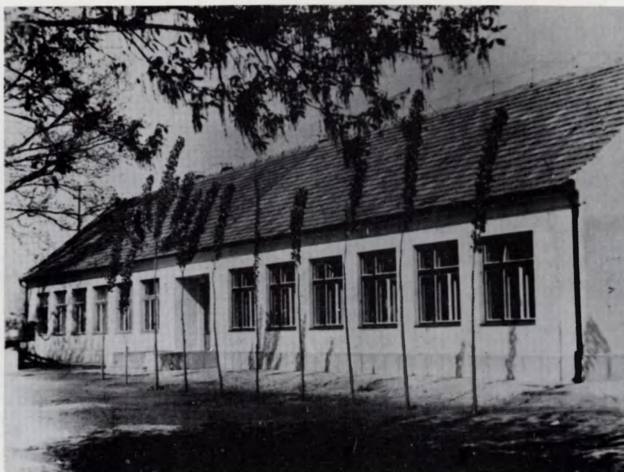
Az 1960-as években épült négy tanterem