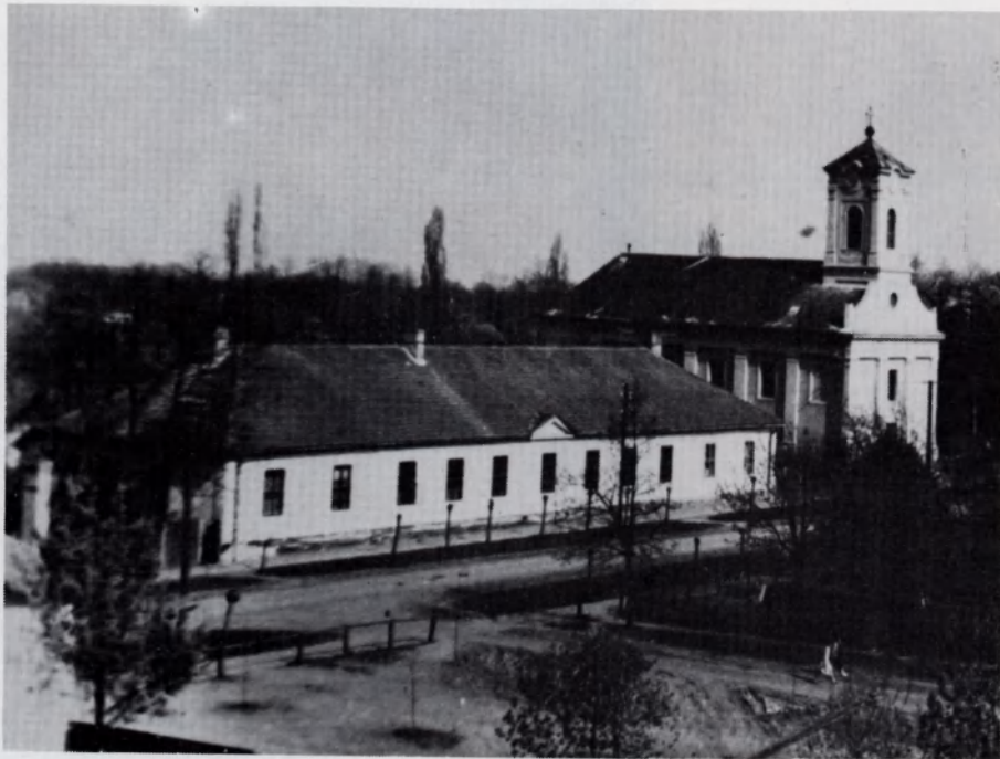
Templom melletti iskola