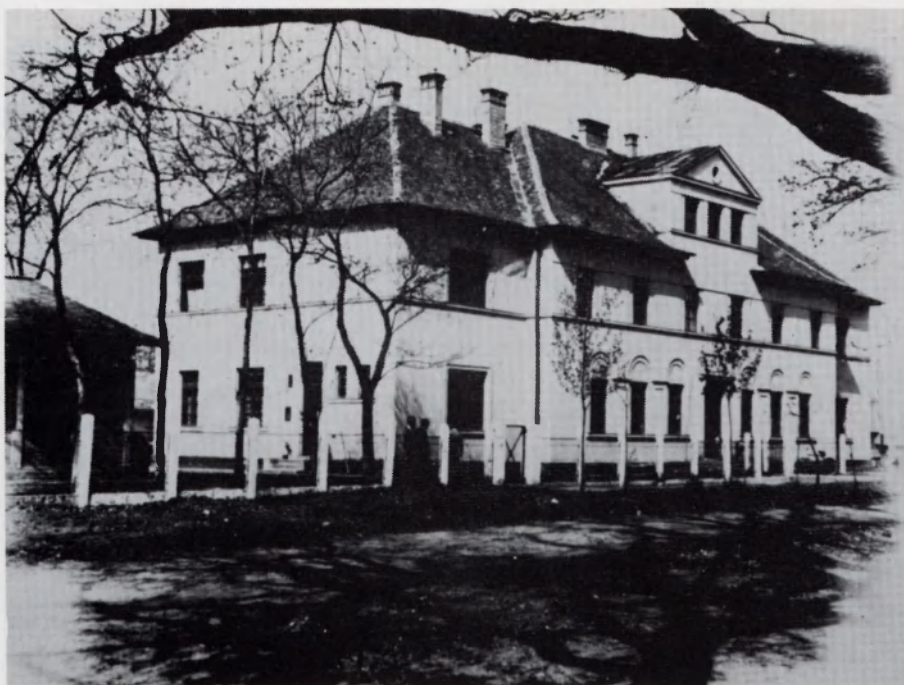
Általános iskolai diákotthon