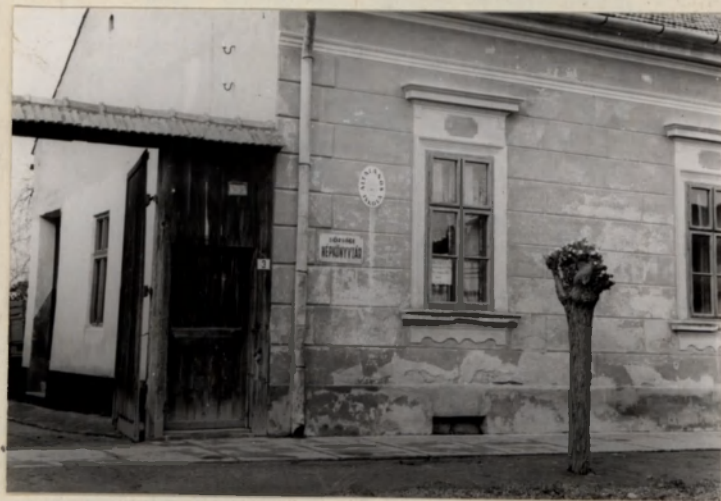
Könyvtár az iskolában