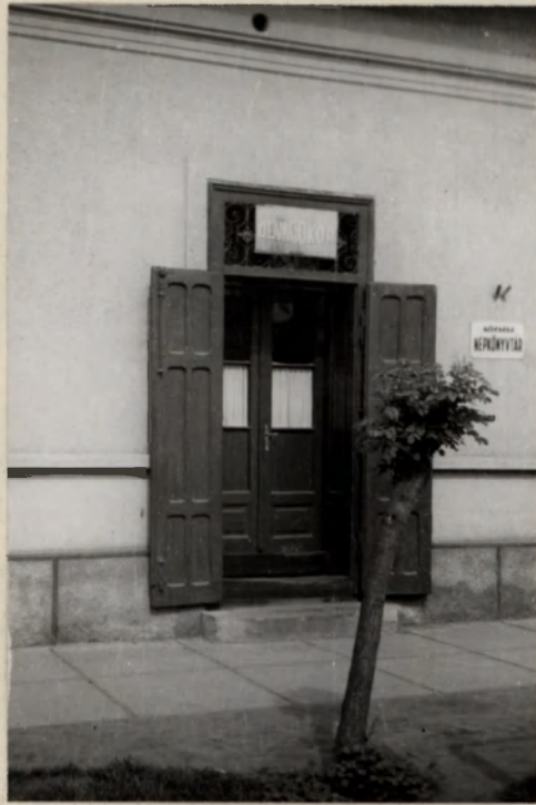
Könyvtár az Olvasóköriben