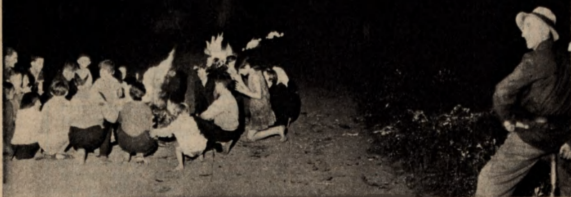
Az első nagy lobogás után a hosszú utcán végig egymás után lángol föl a többi tűz

A Békés megyei eleven néphagyományok egyike a Kevermesen évről évre megismétlődő Szent Iván-napi tűzgyújtás szokása. Estefelé, hét óra körül kezdik összegyűjteni a tűznek valót, ami rozséból, de leggyakrabban kukoricaszárból és cirokszárból áll. A máglya megrakásában és a tűz átugrásában csak a gyerekek vesznek részt, legfeljebb 16–17 éves korig. A tűzrevaló hordásában a „csöpetek”, a 3–5 éves legkisebbek is segítenek, de amit ők hoznak, azt nem teszik a többihez. Lesik, hogy mit csinálnak a nagyok, és maguk is kismáglyát raknak, mint ahogy a disznóöléskor kistűzet. A készülődés nemcsak a fiatalok ügye, igazi izgalommal várják az ünnepi eseményt a felnőttek is.