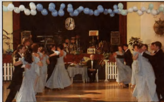
Holiday Társastáncklub 20 éves jubileumi gálaműsora