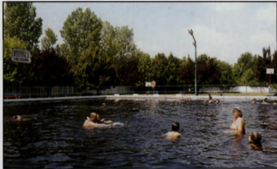
A Parkfürdő „Borostyán” gyógyvizű medencéje

Szálláslehetőségek: Dobó Panzió (II. o. 10 fő), középiskolai kollégium (70 fő), Parkfürdő melletti kemping.