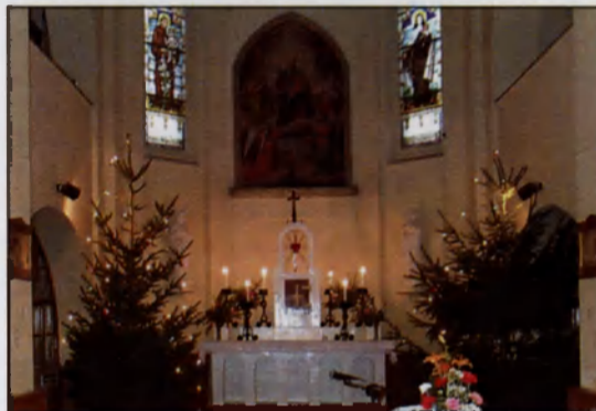
Millenniumi karácsonyi oltár a katolikus templomban