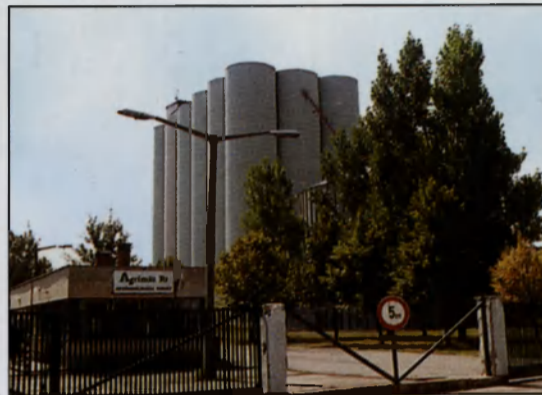
AGRIMILL Rt. gabonatarolója