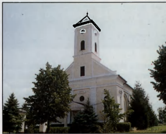
Református Templom. Falain márványtábla őrzi a hősök emlékét

A település arculatán az elmúlt másfél évtizedben a kisvárosi jelleg egyre markánssá- bá vált. A fejlesztések eredményeképpen az említett időszakban 16 utca kapott aszfalt- burkolatot, 258 lakás épült, kiépítésre került a kábel tv, megvalósult a biológiai szennyvíz- tisztító-telep, korszerűsítették a közvilágítást, kialakították a piacteret. Autóbuszpályaud- var, posta, sütőüzem, napközikonyha épült, bővült a városháza, megépült a Crossbar tele-