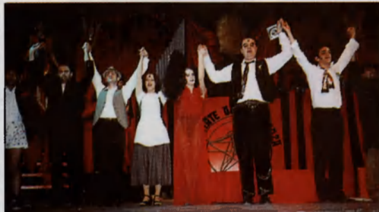
Crazy Theatrum: Vörös malom c. musical