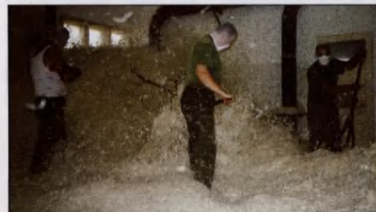
Tollfeldolgozás / PANNON-FEDERN Szolgáltató Kereskedelmi és Termeltető Kft.

Célunk, hogy a település gazdasági potenciálja növekedjen, a piaci hatékonyság javuljon, a szociális biztonság erősödjön, a lakosság életminősége javuljon, az elvándorlás megszűnjön és a vidéki életforma kívánatos legyen a fiatal generáció számára is a városunkban. Ehhez szükség van a kistérség gaz-