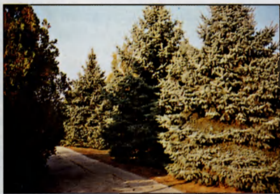
Ezüstfenyők a Fótéren