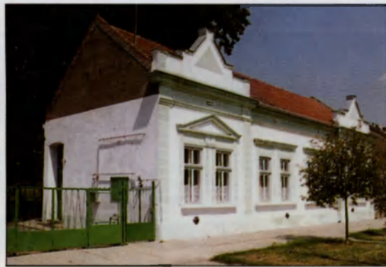
Reformátuskovácsházi Általános Iskola alsótagozatos épülete

A város egyetlen középfokú oktatási intézménye a Hunyadi János Gimnázium, Szakközépiskola és Kollégium – melyet 1952-