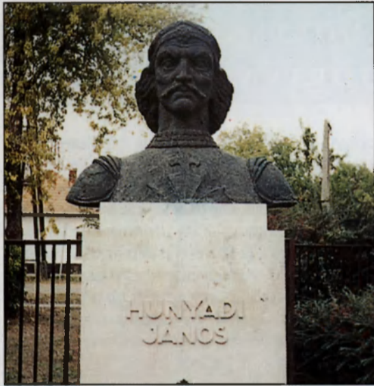
Herczeg Klára: Hunyadi János szobra

gi körülmények között élt, s így a kovács háza mellé újabb házak is épültek. A hosszú évtizedek alatt kialakult település ennek következményeként kapta a Kovácsháza nevet. Mivel a házak az út mellett hosszan elnyúlva épültek meg, a település neve a XIX. sz. végé felé Hosszúkovácsháza névvel bírt, majd a település fejlődése, újabb házak, utcák építése után kialakult végleges neve: Mezőkovácsháza.