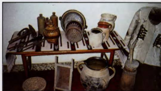
Városi Könyvtár helytörténeti gyűjteménye