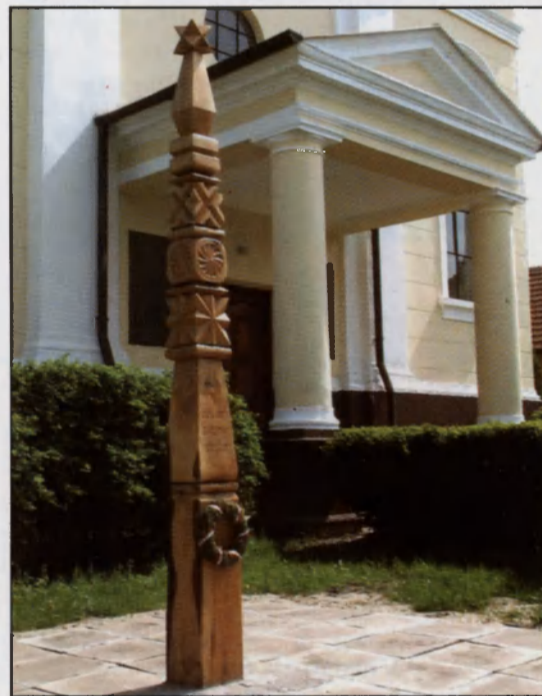
Kopjafa a református templom előtt

Az I. és II. világháború mérhetetlen vi-