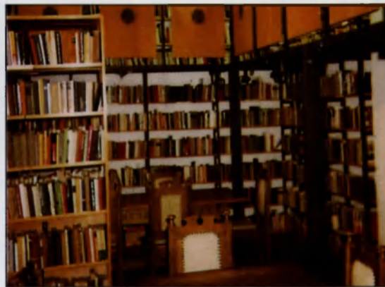
Városi Könyvtár belső

ben alapítottak –, 1997-től megyei fenntartásban működik. A nagy hagyományokkal rendelkező, napjainkban dinamikusan fejlődő, a jövőben várhatóan a Dél-Békési kistérség oktatási centrumává váló intézményben a gimnáziumi oktatás mellett számítástechnikán alapuló szakmában, – gazdasági informatikus szakon – közép és felsőfokú, akkreditált szakképzés is folyik.