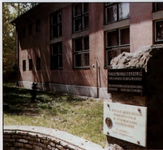
Az emléksétányon az október 23-i emlékoszlop (1956-os forradalom és a Magyar Köztársaság kikiáltásának 10. évfordulójának emléktáblája

fonközpont, az általános iskola 8 tanterem- mel, a Hunyadi János Gimnázium 4 tantee- remmel bővült. A Művelődési Központ előtt kialakításra került a Történelmi Emléksé- tány. Emlékszobrot emeltek a II. világháború hősi halottai és a millennium tiszteletére. A honfoglalás milicentenáriuma Emlék- parkot hoztak létre és kopjafát állítottak. 1998-ban elkészült a katolikus és református templom éjszakai díszvilágítása.