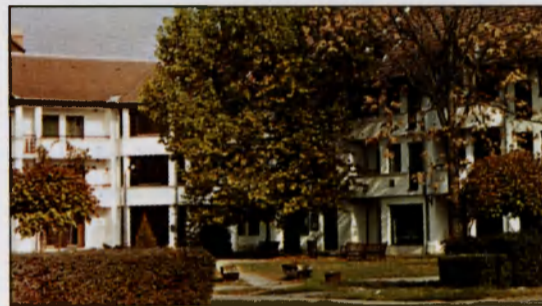
Társasház az Áprád utcán

A településünk részt vett az Európai Unió mezőgazdasági és vidékfejlesztési tervének (SAPARD) kidolgozásában, a Dél-Békési kistérségre vonatkozóan.