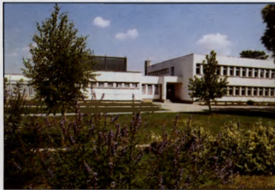
Általános Iskola alsótagozatos épületrésze

A város közoktatási intézményrendszere magában foglalja a tevékenységközpontú óvodai nevelést, az általános iskolai tanítást, ahol a diákok választása szerint emelt szintű