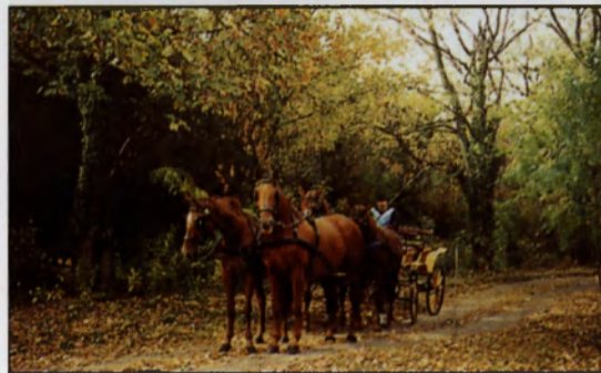
MTE Lovas Szakosztály négyes fogata