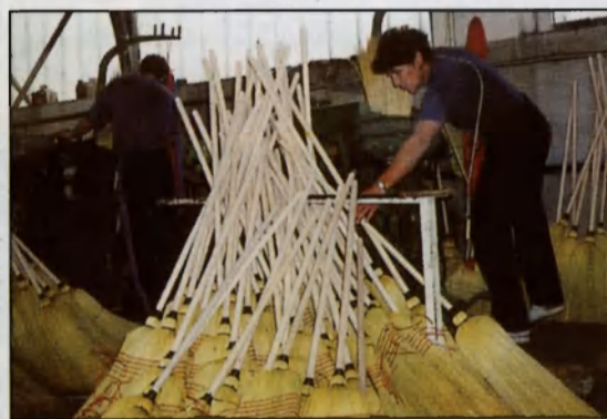
Seprűcirok feldolgozás Zengő Ipari és Kereskedelmi Kft.

Mezőkovácsháza regionális szerepe ismét növekszik a közigazgatásban. A Városi Gyámhivatal 1997-től, az Építésügyi Hatóság 1998-tól az Okmányiroda 2000-től kezdte meg működését. Mindhárom hatóság illetékessége 16 településre terjed ki.