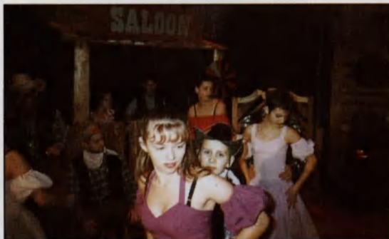
Crazy Theatrum: Színezüst Csehó c. western musical