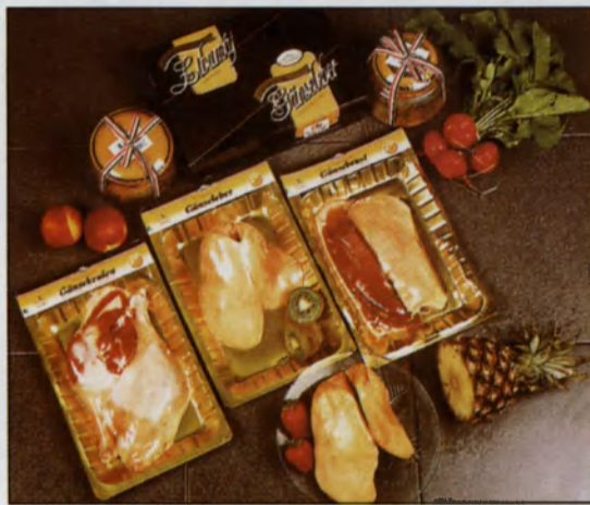
Hajdú-Bét Rt. termékei

mékek piacrajutásának elősegítésére, vállalkozások létrehozására és fejlesztésének segítésére. A vidékfejlesztési célkitűzések megvalósítását elősegítő emberi erőforrások fejlesztése mellett törekszünk városunk kulturális és közösségfejlesztő programjainak szélesítésére.