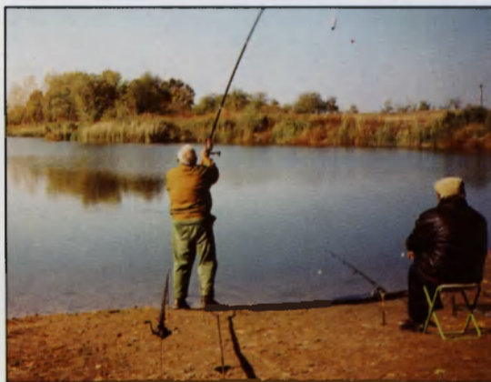
A Horgász Egyesület tagjai horgászás közben

Az utóbbi években városunkban is kezdenek kialakulni a civil társadalom szervezetei. Az élet minden területén a felmerülő igényeknek megfelelően alakultak és alakulnak civil szerveződések. Jelenleg 19 egészségügyi, városvédő, jótékonyági, sport, kulturális, művelődési és egyházi célok megvalósítását kitűző szervezet működik.