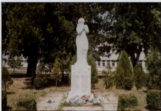
Corvus-Kora Róbert: II. világháborus emlékmű

Mezőkovácsháza 1950-től kezdődően tartozik Békés megyéhez. Az 1945 és 1970 közötti mérsékelt fejlődési periódust követő- en, 1971-től a község fokozott mértékben fej- lődött. 1971-ben a Kormány döntése alapján az országos településfejlesztési koncepció